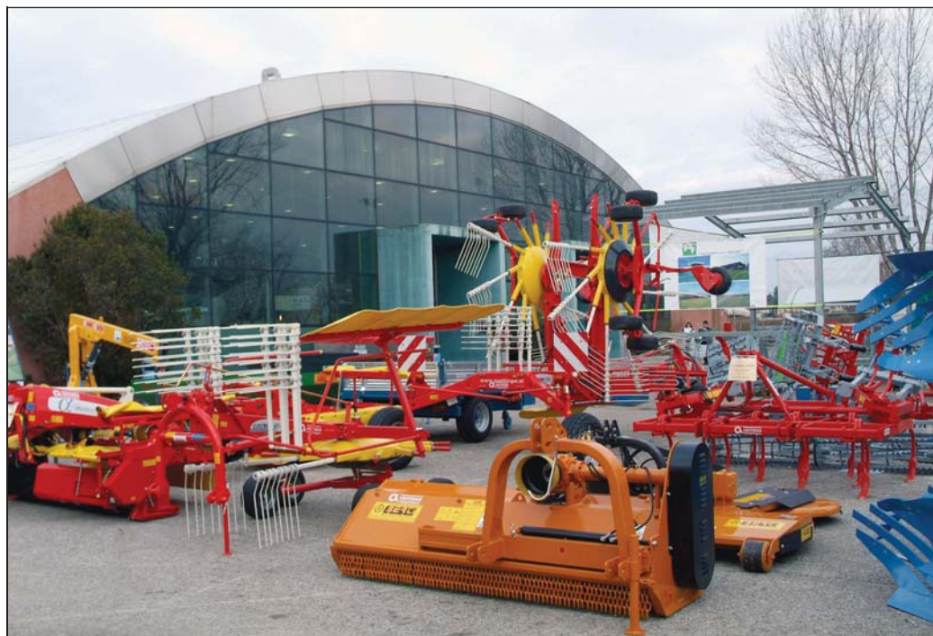
[ Ad Agriest espongono circa 250 aziende che entreranno in contatto con 40 mila visitatori

Certo. E l'abbiamo recentemente dimostrato con la fiera