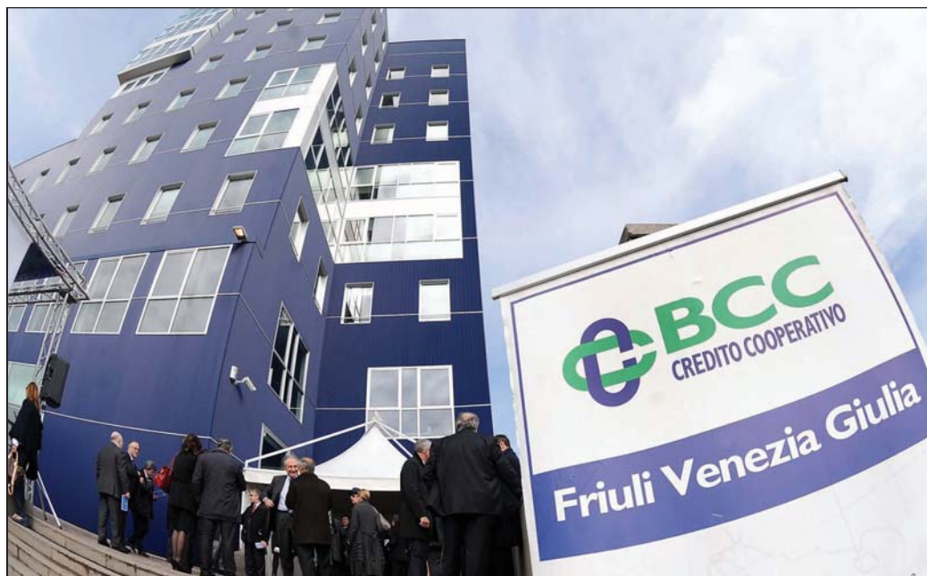
[ Sede delle Banche di Credito Cooperativo del Friuli Venezia Giulia.