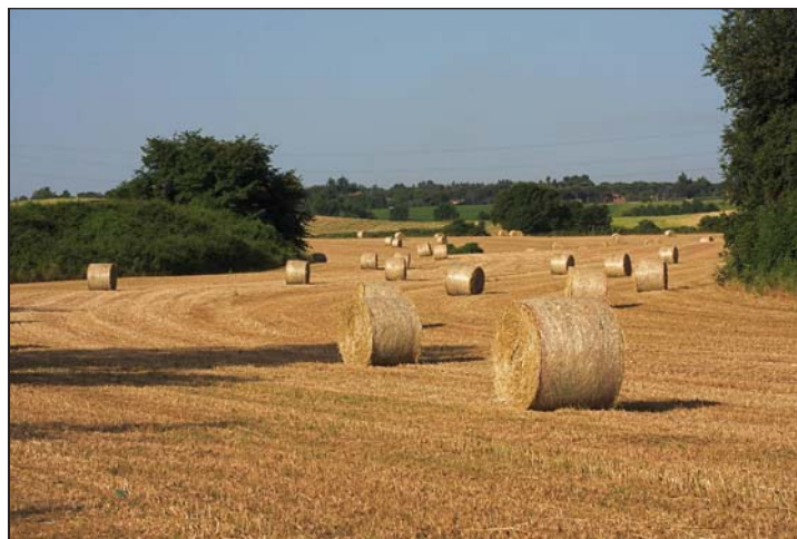
[ Rafforzare la competitività del prodotto italiano è l'obiettivo delle ricerche finanziate da Ager