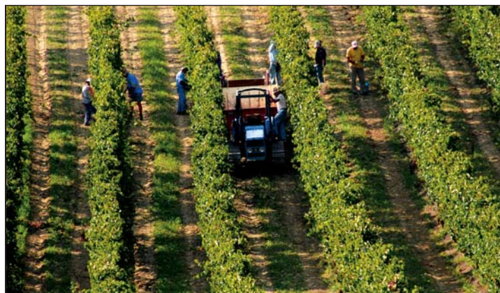
[ In Friuli Venezia Giulia nonostante la forte contrazione territoriale rimane ancora forte la vocazione agricola

Agricoltura, Alimenti, e Ambiente. Per questo l'offerta formativa si è opportunamente adeguata e la nostra Facoltà, con un numero di immatricolati in costante aumento, attrae sempre più diplomati provenienti da licei e scuole non di impostazione agraria. Aumentano pure gli studenti da fuori Regione, anche per importanti accordi con Atenei di Regioni contermini.