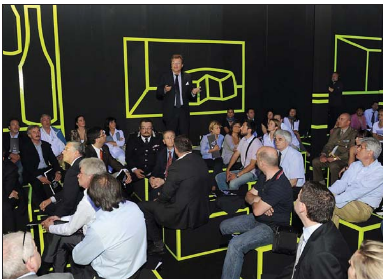
[ Un incontro-convegno organizzato da Ciboduemilaventi con format ed allestimenti inediti

E infatti, Cibo2020 accompagnerà l'economia friulana in un straordinario appuntamento: un temporary store alla Triennale di Milano, in cui i nostri artigiani del gusto vendono i loro prodotti e li promuovono in un modo e una location innovativi. Una proposta arrivata da uno dei primi amici illustri di FFF, proprio il presidente della Triennale Davide Rampello, che, il prossimo marzo, ospiterà per una decina di giorni convegni, mostre ed eventi sulla realtà agroalimentare Fvg. Un modo molto future di portare su un palcoscenico di altissimo livello e assoluta novità il nostro foodcraft e l'intera realtà d'impresa friulana, nel suo connubio unico di uomini, territorio e prodotti. ■