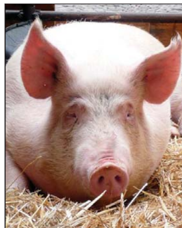
[ Il progetto del suino geneticamente friulano può dare in prospettiva molte soddisfazioni.

Regione che produce carne e latte di alta qualità non può pensare di buttarsi in braccio alle produzioni generiche e di basso prezzo. Bisogna assolutamente concentrarsi sulla produzione di pochi prodotti di altissima qualità e con questi andare sui mercati che li possono remunerare adeguatamente, il tutto sotto un'unica regia. L'alleanza con il settore del turismo e della ristorazione regionale diventa fondamentale, è necessario qualificare il turismo attraverso l'agricoltura ed il territorio e la propria tradizione culinaria, diventa un'arma in più per tutti. Il Progetto del Suino Geneticamente Friulano e della produzione di sola Pezzata Rossa, sono il primo tentativo di risposta che il mondo degli allevatori, con l'aiuto dell'Assessorato Regionale all'Agricoltura