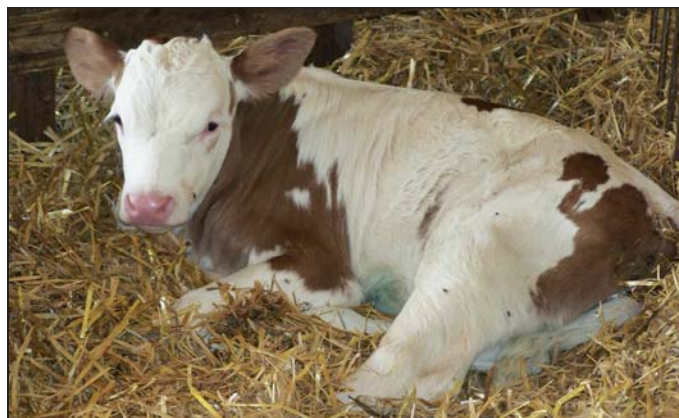
[ Occorre puntare con decisione al miglioramento dell'efficienza alimentare e produttiva degli allevamenti