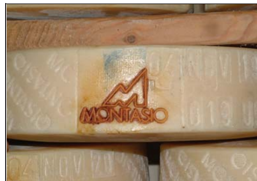
[ Montasio , la seconda Dop regionale dopo il San Daniele.